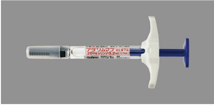
■ アダリムマブBS皮下注20mgシリンジ0.2mL〔CTNK〕